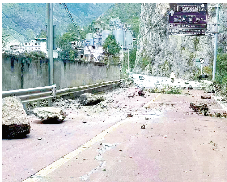
四川甘孜州泸定县发生6.8级地震

根据习近平指示和李克强要求,应急管理部、自然资源部、国家卫生健康委等部门已派出工作组赶赴灾区指导救援救灾。四川省、甘孜州已组织救援力量开展救灾工作,并紧急调拨帐篷、棉被、折叠床等救灾物资运抵灾区。抗震救灾各项工作正在紧张有序进行。