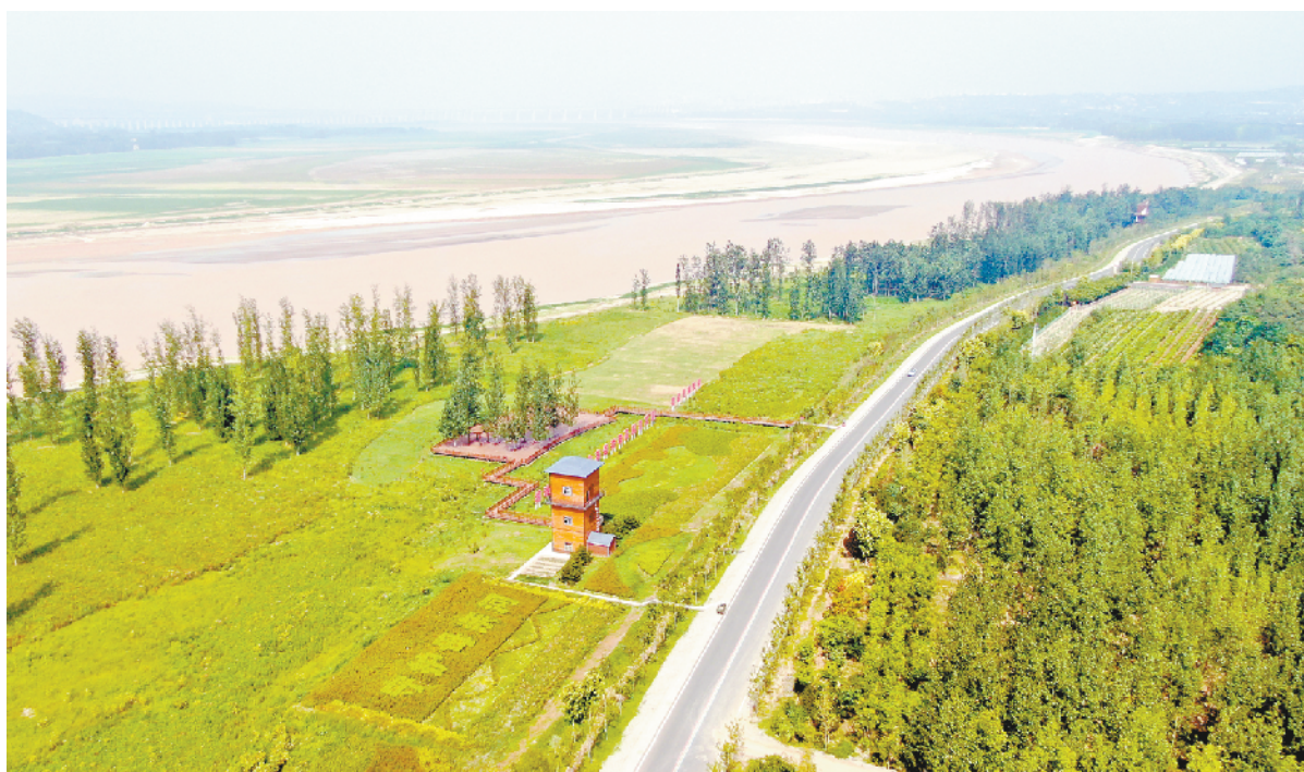
这是2022年8月10日在河南省三门峡市拍摄的黄河生态廊道(无人机照片)。

习近平总书记充分肯定相关意见建议具有很强的针对性和建设性,表示“我们将认真研究、积极吸纳”。在“十四五”规划建议等重大政