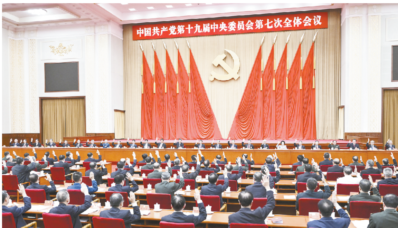
中国共产党第十九届中央委员会第七次全体会议，于2022年10月9日至12日在北京举行。中央政治局主持会议。新华社记者 燕雁 摄