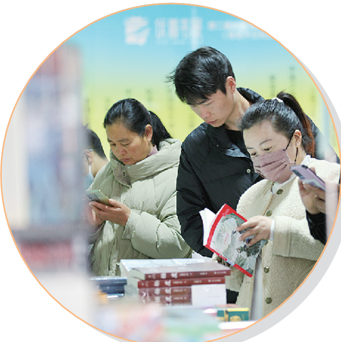
众多到淮阳庙会旅游的群众在伏羲书展选购图书。