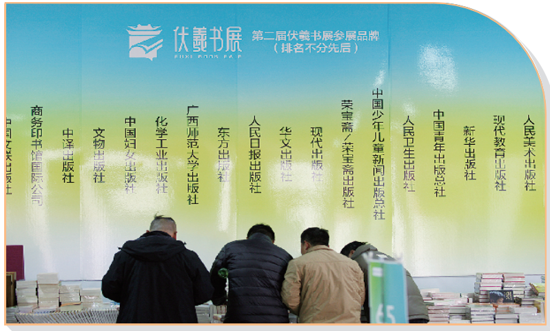
众多知名出版社为伏羲书展助阵。