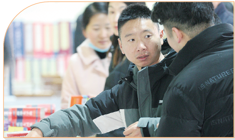
市民争先购买图书。