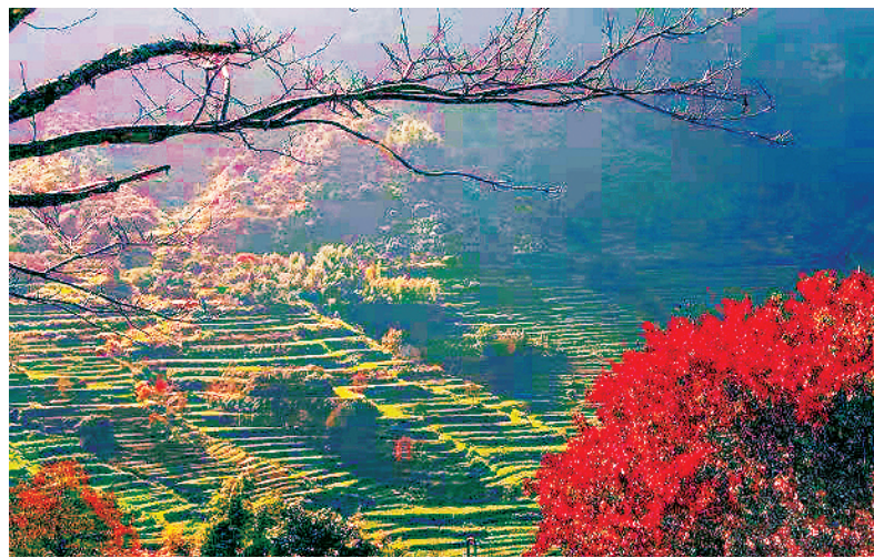
待到山花烂漫时

让人物和作品回到日常生活之中,回到最为平常又最为本质的情感之中,是《我的黄河我的城》的最大特点。小说中四代人生命中的70年,是许多家庭走过的路,里面有我们亲身经历又无比感动的生活细节。在更大的视野中,这是中国跨越式发展的缩影,是一份亲切又极具现实性的时代记录。(摘自《人民日报》海外版)