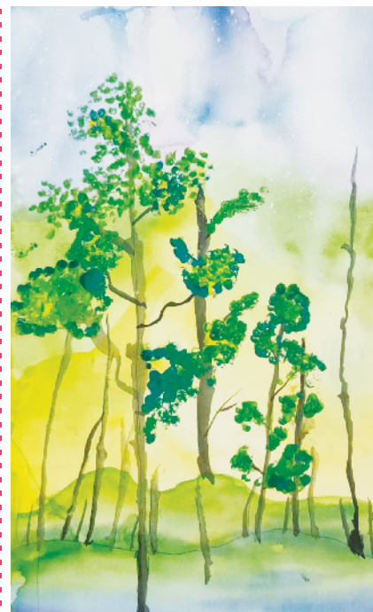
小记者：梁恒宇 周口市六一路小学三(5)班 (辅导老师：苏蕊)