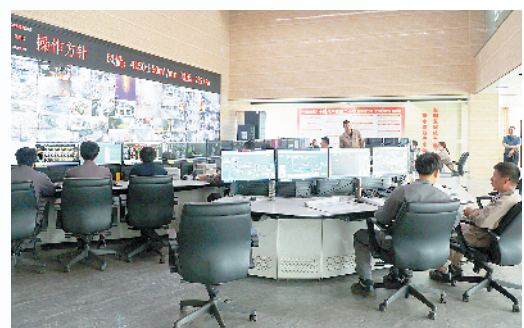
技术人员监控设备运行状况。