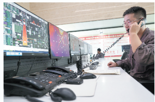
工作人员了解生产情况。

在这片充满生机与活力的土地上,打造一座国内领先,环境、管理、产品、效益一流,极具竞争力、影响力、带动力的绿色智能钢铁制造基地,周钢人的梦想一定能够实现!②18