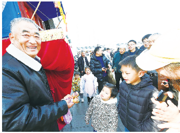
布袋木偶艺人和观众交流。