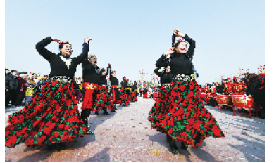
少数民族居民表演民族舞蹈。

年味是什么？挂红灯、穿花衣、品美食、赏民俗……周口大地处处彩灯璀璨、民俗活动精彩纷呈。龙年春节，关帝庙历史街区和南寨历史文化街区盛装迎春，“三川十馆·春会”和“春满中原 老家河南”年会在哪里相遇，酿出醉人的年味。